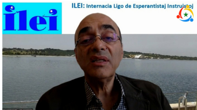
ILEI: Internacia Ligo de Esperantistaj Instruistoj

kaj ILEI kongresoj. Ahmad parolis pri aparta graveco de virtualaj renkontiĝoj, kiuj donas al Esperantujo esence novajn rimedojn por komunikado. Kiel ekzemplon li nomis tre sukcesan ĉi-jaran virtualan kongreson de ILEI – VEKI.