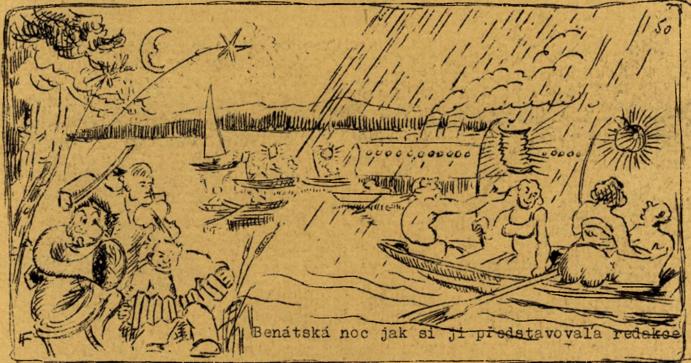
Benátská noc jak si ji představovala redakce

nějakým pirátům, byť by byli něžného pohlaví. A tak se jim podařilo vyváznouti z boje bez jediného zranění.