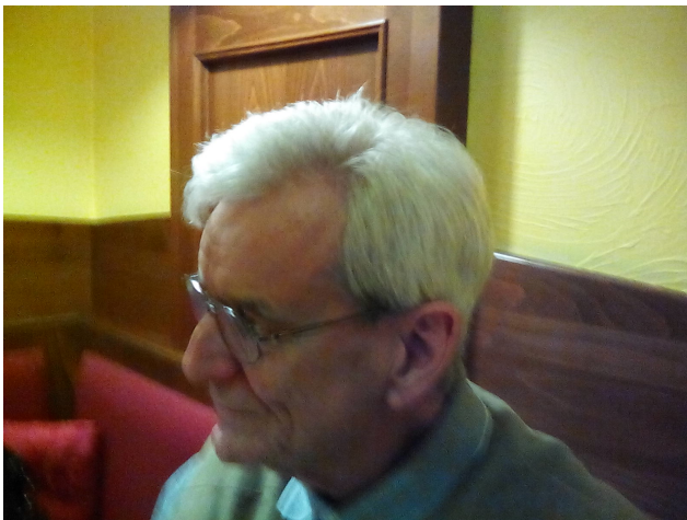
Abbildung 5: Vernerego

Ni krome gratulis al Vernerego pro sia okazinta naskiĝdatreveno.