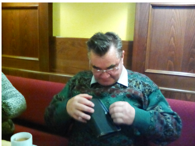
Abbildung 1: Vernereto