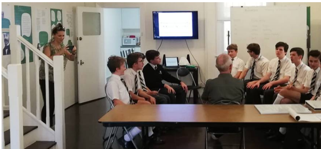
Figuro 1:

Antaŭ ol la grupo foriris, la instruisto esprimis intereson organizi alian eventon, eble per Zoom.