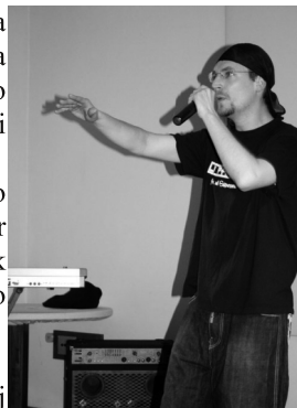
Platano (La Pafklik')