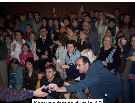
Komuna fotado dum la AS

Jam la kvinan fojon sub nomo de Ago-Semajno (AS) okazis junulara novjara aranĝo en Pollando. Partoprenis ĝin rekorda kaj, por esti sincera, eĉ por organizantoj surpriza kvanto da homoj. Entute venis 187 personoj el 24 landoj. Plej multnombre el Ukrainio, Pollando kaj Rusio.