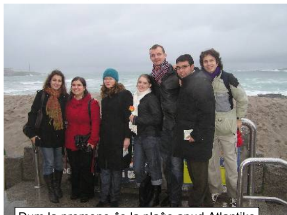
Dum la promeno ĉe la plaĝo apud Atlantiko

La aŭtoro de la artikolo dankas al TEJO pro la provizita ebleco partopreni en ĝia nomo la seminario de CJE en Korunjo, kaj al la Komisiono pri Eksteraj Rilatoj kaj la volontulo de TEJO pro la helpema perado de la aliĝo al la seminario, kio igis tiun ĉi neforgeseblan sperton ebla.