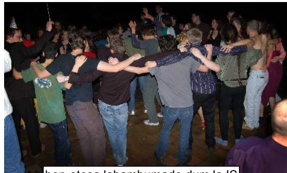
bon-etos labambumado dum la IS