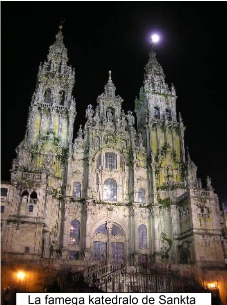
La famega katedralo de Sankta Jakobo en Santiago de Compostela