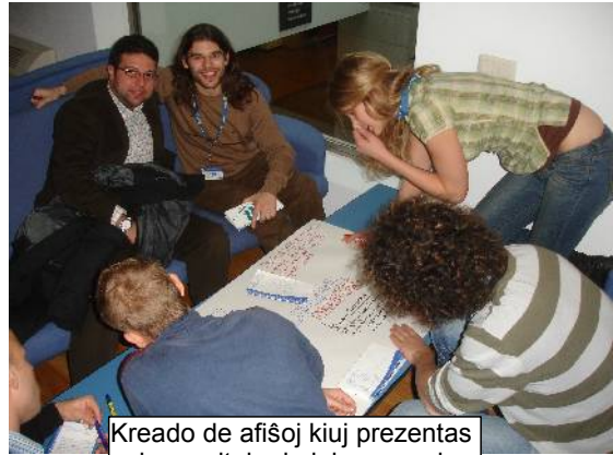
Kreado de afiŝoj kiuj prezentas la rezultojn de laborgrupoj.

Esperanto. Ankaŭ kelkaj aliaj partoprenantoj de la seminario interesiĝis pri la temo, kaj tial mi profitis mian ĉeeston ankaŭ por iom varbi. Cetere, ankaŭ dum formado de opinioj kaj konsiloj ene de laborgrupoj mi strebis enkonduki kaj diskutigi temojn rilatajn al la agado de TEJO - ekzemple emfazon de justa internacia komunikado, subtenon por lernado de fremdaj lingvoj kaj interkultura klerigado.