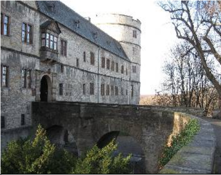
La kastelo Wewelsburg – la ĉi-jara IS-ejo

Dum duona jarcento, junuloj el diversaj landoj kaj kulturoj kuniĝis ĉiujare en Germanio por celebri Silvestron kune. Estus malĝuste festi tiun solenan okazaĵon ie ajn krom en la plej deca loko, kaj la organiza teamo certe ne lasis nin fari tion. La kongresejo trovita estas triflanka kastelo Wewelsburg, ekkonstruita en 1603, kiu situas apud al la urbo Paderborn proksime al la centro de la lando. La kastelo iĝis la sidejo de Heinrich Himmler kaj la SS dum la nazia epoko, sed nun estas uzata la plej granda junulargastejo en Germanio.