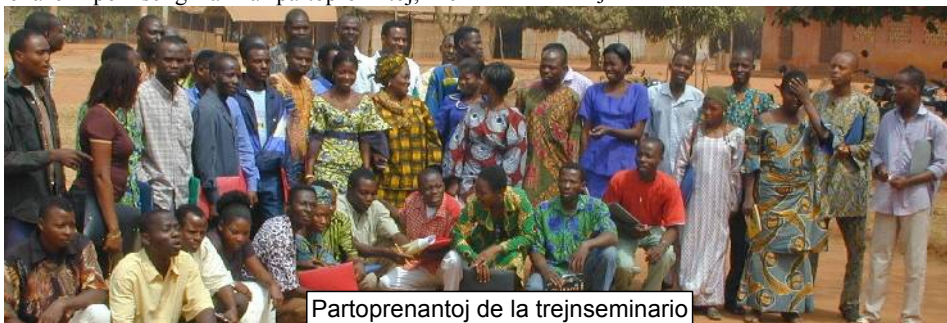
Partoprenantoj de la trejnseminario