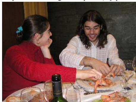
En la solena vespermanĝo ne mankis ankaŭ tipa loka manĝaĵo - mariskoj

Resume tamen la aranĝo postlasis en mi bonajn impresojn. Mem la unua fojo en Hispanio estis tre granda sperto (kaj post la