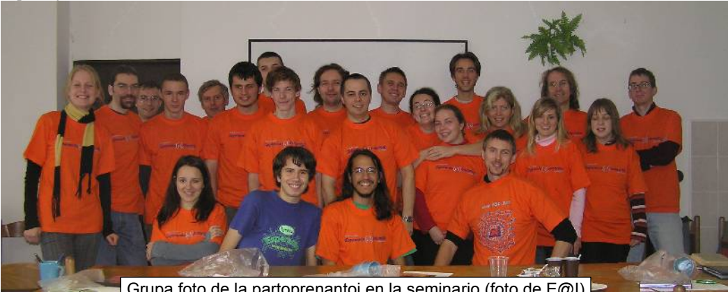
Grupa foto de la partoprenantoj en la seminario