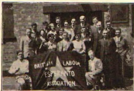
Partoprenantoj de la tutlanda BLEA-konferenco (9.10.6.1935 en Londono)

Adreso: La Ekspozicia Komitato de SEL, n-o 14 Lane 169, Carter Road, Shanghai, Ĉinio.