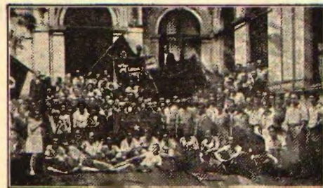
ANTAŬ 3 jaroj: fondkongreso de IPE en Berlino (20-25.8.1932). Ĉeestis 348 gek-doĵ el 11 landoj, inter kiuj estis 46 gedelegitoj de sekcioj k UK-oj.

Sen "Sur Posteno" ŝip' sen kompasoj Abonu, abonigu, varbu!