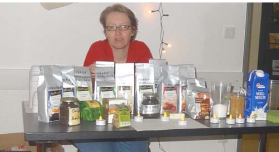
Julia proponas diversajn teojn en la gufujoj

Tajlando, kaj Siberio. Kun Amri al Nepalo, Israelo, kaj sur monton Kilimanĝaro en Tanzanio.