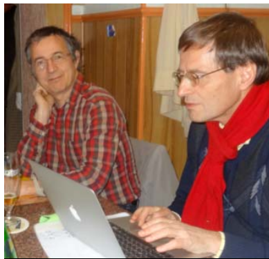
Bernard diligente konsultas etimologian vortaron