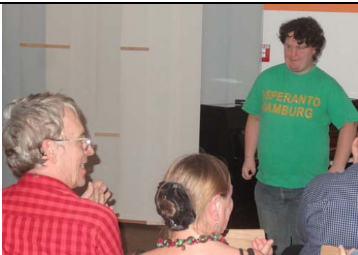
Kaŝi: virtuoza pianisto, kantisto

La festivalo Luminesk daŭrigas la longdaŭran tradicion de IF-Internacia festivalo.