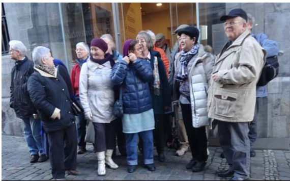
Vizito al gazetara muzeo

Alian sesion profesoro Amri Wandel faris pri relativec-teorio. Okazis sukcesa ekzameno de parkera kantado de E-himno "La Espero".