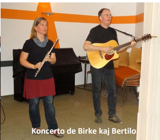
Koncerto de Birke kaj Bertilo

en "Knajpo ", taverno, kie sidadas babilemaj alkoholemuloj, kaj en romantike kandela Gufujo, kie estas servata diversaj teoj kaj tizanoj.