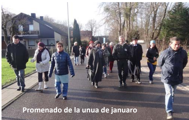
Promenado de la unua de januaro

en "Knajpo ", taverno, kie sidadas babilemaj alkoholemuloj, kaj en romantike kandela Gufujo, kie estas servata diversaj teoj kaj tizanoj.