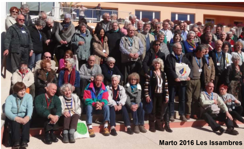
Marto 2016 Les Issambres