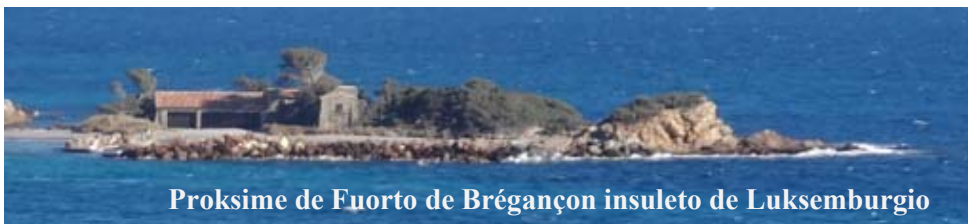
Proksime de Fuorto de Brégançon insuleto de Luksemburgio