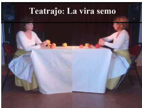
Teatraĵo: La vira semo

En la hotelo, kie okazis la aranĝo ni tre bonguste kaj abunde manĝis. Dum