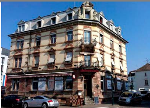
Hotel-Restaurant Porte de France

Temas pri "Hotel-Restaurant Porte de France", 94 avenue de Bâle, Saint-Louis, tute proksima al la land-limo al Svislando.