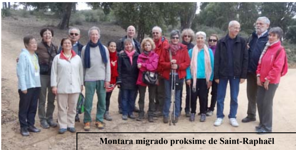
Montara migrado proksime de Saint-Raphaël

libera tempo iuj kartludis, aliaj lernis danci, legis aŭ komputilis. Eblis ankaŭ partopreni en distraj aktivaĵoj kaj aliaj proponoj de la hotelo mem. Kelkaj el ni profitis tion. Ni povis partopreni en diversaj vortludoj, danco, manlaboroj, enigmoj, gestuno, skrablo, karaokeo-kantado ktp.