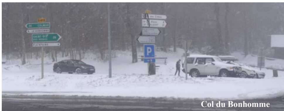
Col du Bonhomme