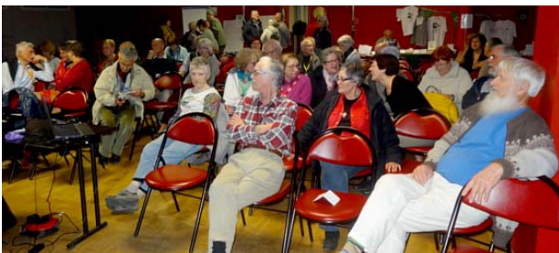
La vespera programo iomete malfruas