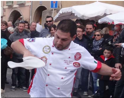
En Roquebrunnès, ĉe ĉokoladofoiro: turnigado de pico