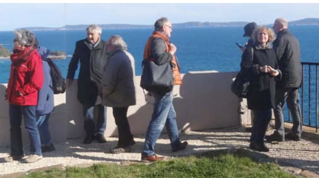
Ekskurso al fuorto de Brégançon

Dimanĉe kelkaj el ni vizitis la urbon Fréjus dum aliaj ĝuis ĉokoladan feston en la apuda urbeto Roquebrune-sur-Argens . Tie ni admiris grandegan ĉokolad-tabulon. Ĝi pezis 220 kg, estis du metrojn longa kaj dek centimetrojn dika. Poste oni dispecigis ĝin kaj disdonis al la vizitantoj. Vespere ni spektis la teatraĵon “La Viro-Semo”, kiu estis ankaŭ prezentita dum la UK en Lillo.