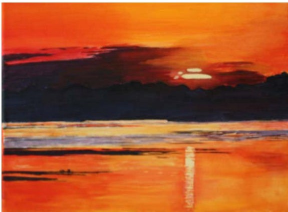
Alia pentraĵo de Kris: sunsubiro ĉe la Danuba delto en Rumanio

Ni mem volontulas (DV) labori dum monato ĉi-printempe en la Interkultura Centro en Herzberg am Harz, Germanio. Dum pli ol dek jaroj Herzberg titolas sin ‘ die Esperanto-Stadt’, ĉar ĝia es- traro agnoskas Esperanton kiel utilan pontolingvon en ligoj ali- landaj. Ni anticipas tie pluan edukadon pri kiel Esperanto obstine strebas al ĝia celo.