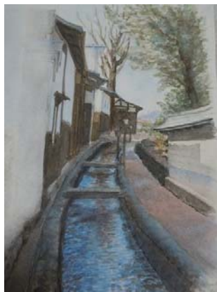
Akvarelo el Japanio