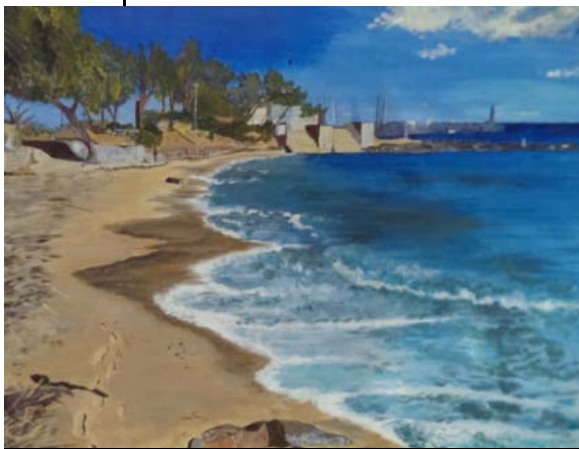
Pentraĵoj de Kris: la plaĝo ĉe Les Issambres