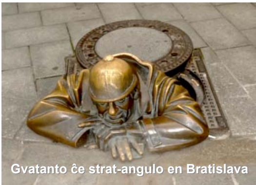
Gvatanto ĉe strat-angulo en Bratislava