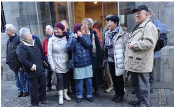
Vizito al gazetara muzeo