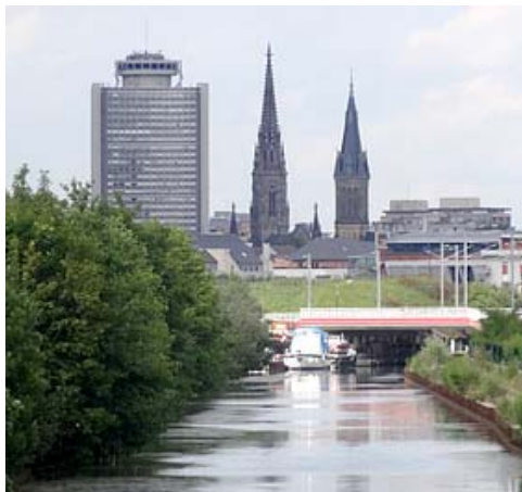
Mulhouse fotita ekde Brunstatt