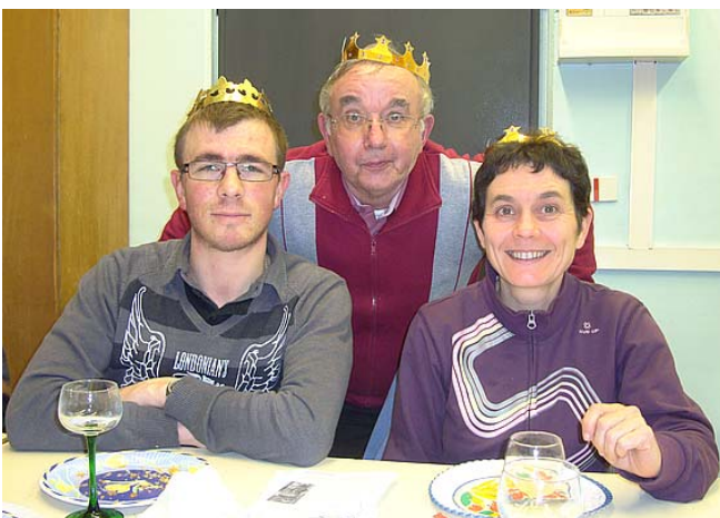
Nia festeto finiĝis kun 3 gereĝoj en simpatia kaj bona etoso.

Ankaŭ estis la ebleco por iuj membroj pruntepreni librojn el nia biblioteko, kiu nun funkcias per la reto.