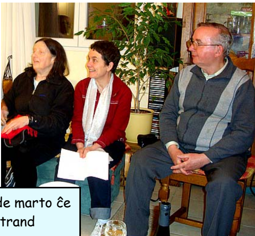
La 28an de marto ĉe Bertrand

Tre lerte li sukcesis proponi diversajn manĝaĵetojn kaj trinkaĵojn por plezurigi ĉiujn. Kompreneble ankaŭ viglis la konversacioj. Eble la kunvenoj en la regiono de Saint-Louis povus estonte ankaŭ esti komunaj kunvenoj kun la grupo de Bazelo.