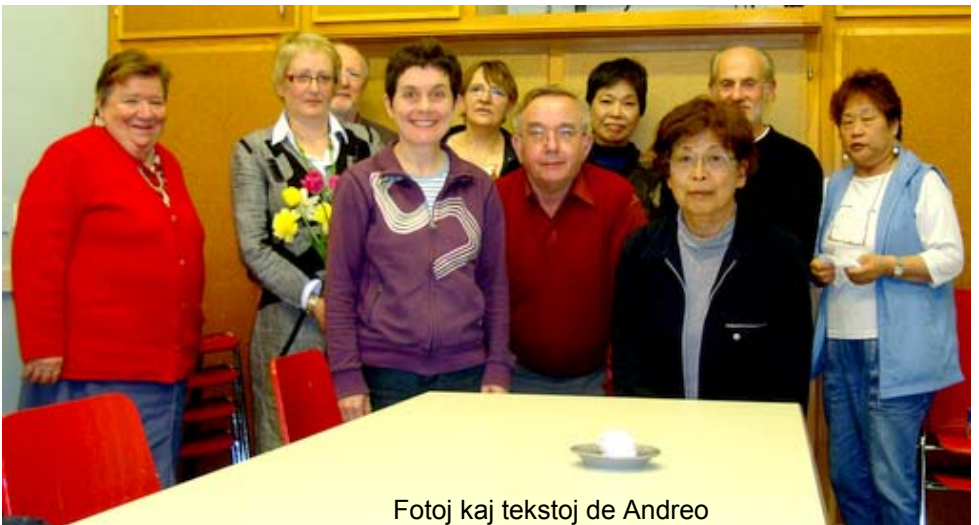
Fotoj kaj tekstoj de Andreo