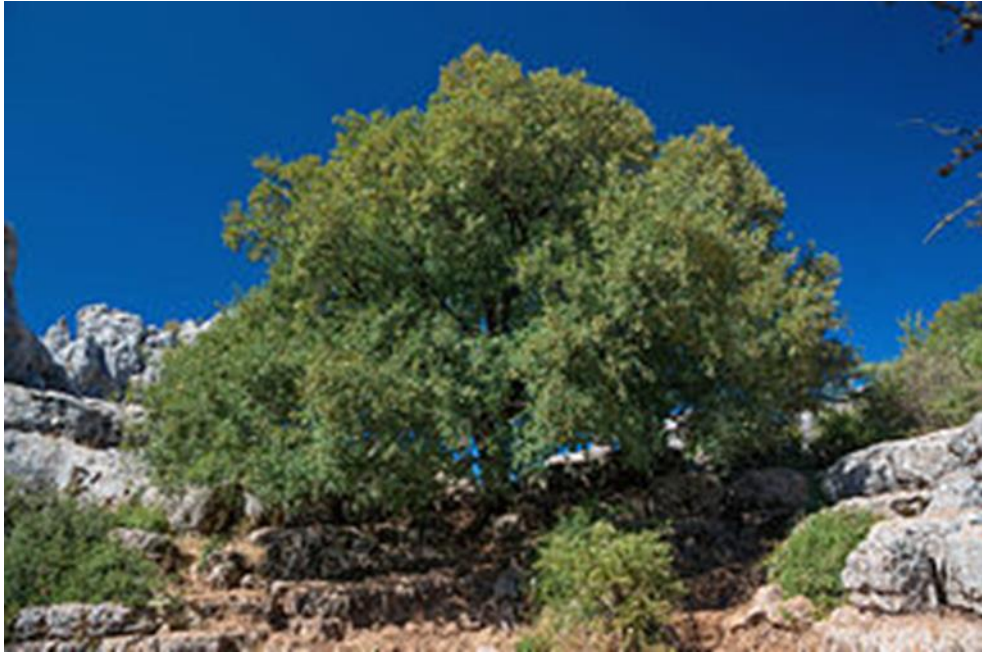
Acero de Montpeliero