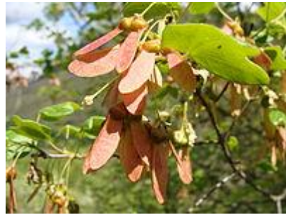
Folioj, floroj kaj fruktoj de la acero de Montpeliero