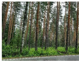
ruĝa pinoj kaj betuloj