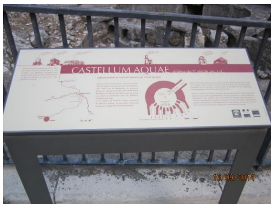
CASTELLUM AQUAE en la latina, tio estas akvujo, aŭ pli ĝuste, baseno por akvodispartigo

Nîmes havas multajn monumentojn el la romia epoko. Unu el ili, kompreneble multe malpli vizitata ol la plej konataj (« la Arenoj » aŭ « la Maison carrée », tio estas « la Kvadrata Domo »), estas tre, tre interesa : temas pri la « castellum divisorium », netaŭga nomo sed tre belparola. Ĝi troviĝas Strato de la Lampèze, piede de la citadelo de Vauban, iĝinta unue malliberejo kaj poste dependaĵo de la universitato.