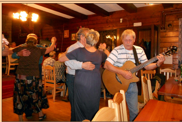
AEH en Ŝtíří Důl