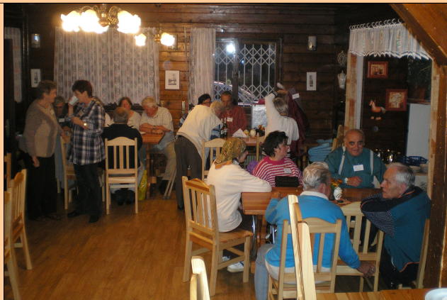
AEH en Ŝtíří Důl