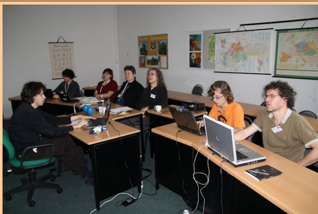
KAEST Modra, Slovakio