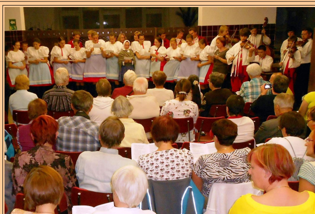
Trilanda Konferenco en Břeclav