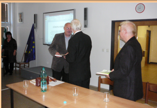
Trilanda Konferenco en Břeclav