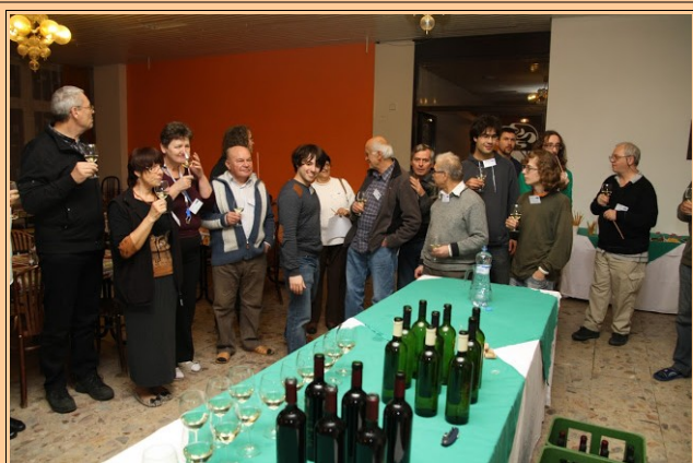
KAEST Modra, Slovakio