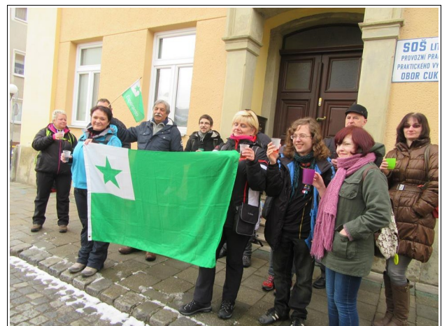
Esperantumado E-mentala en Litovel