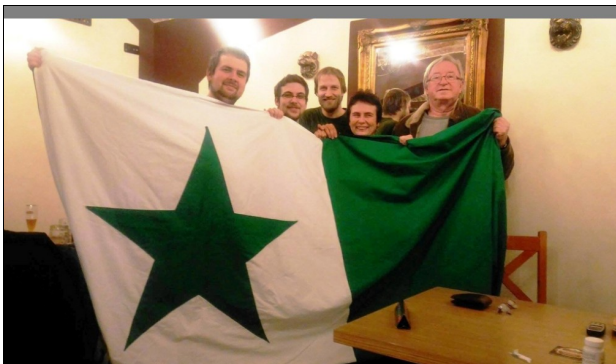
En la restoracio U skřetů en Prago 7, str. Milady Horákové 52, kie eblas ricevi esperantlingvan menuon, E-mentalanoj renkontis konatan aktoron Jiří Lábus