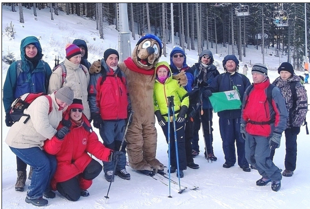
Aranĝo POLUDNICA en Malaltaj Tatroj