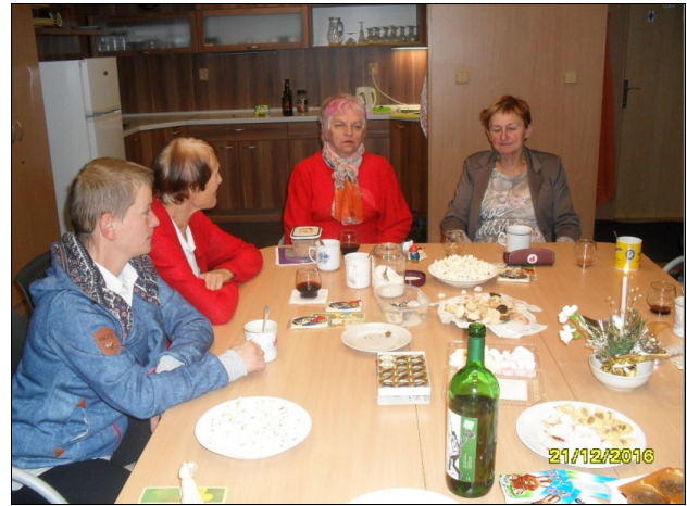
Antaŭkristnaska kunveno en Vítkovice