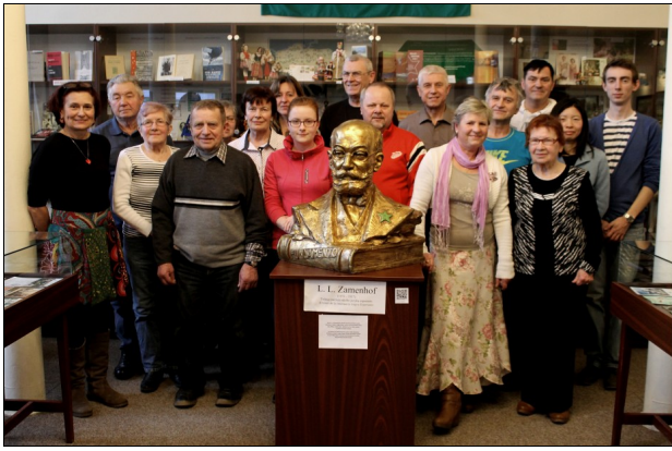
Membrokunveno en Svitavy (18.2.2017)