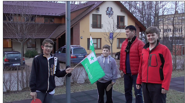
Nova klubo ĉe skoltoj en Kopřivnice