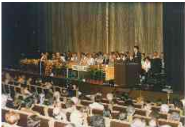
Enrigardo en la salonon Zamenhof

Meze de somero pasos 10 jaroj de nia 81-a UK en Prago 1996. Jes, jam dek jaroj konsumiĝis de nia glora kongreso, kiu estis siamaniere unika ne nur por la enlanda, sed ankaŭ por la tutmonda movado. Estis tie aprobita Praga Manifesto, unuafoje okazis Nitobe-simpozio por aktiva lingvopolitiko kaj eble unuafoje estis por la kongresa kuriero uzitaj komputiloj. La enkomputiligitaj materialoj estis konservitaj kaj eksponitaj en la interreto. Tie oni nun povas vidi materialojn ankaŭ de la sekvantaj kongresoj, sed la Praga estis la unua. Rete troveblaj estas ne nur la kongresaj kurieroj, sed ankaŭ prelegoj de la Kongresa Universitato kaj de la jam menciita Nitobe-simpozio.