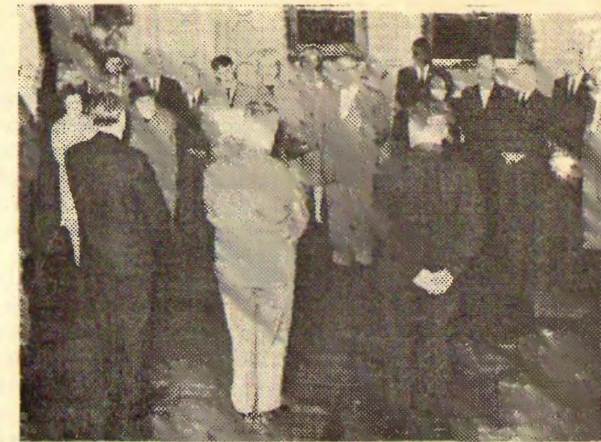
La akcepto en la urbo-domo