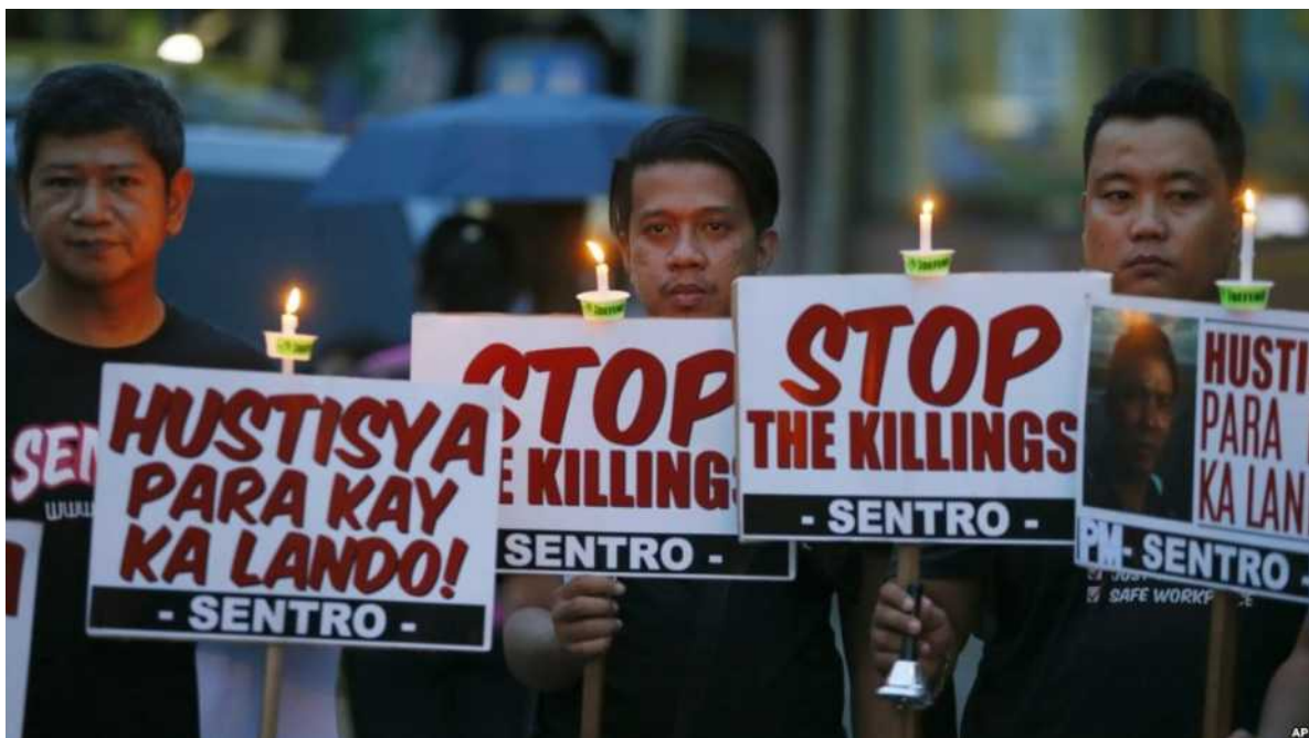
La 8an de oktobro 2016, en la ĉirkaŭurbo de Kezon, nord-oriente de Manilo, en Filipinoj, manifestaciintoj tenas afiŝtabulojn dum kandela kolektiĝo kontraŭ la eksterjuraj ekzekutoj, kadre de la milito de Duterte kontraŭ drogo.

http://neniammilitointerni.over-blog.com/2017/03/filipinoj-restarigo-de-la-mortopuno-proksimigas.html