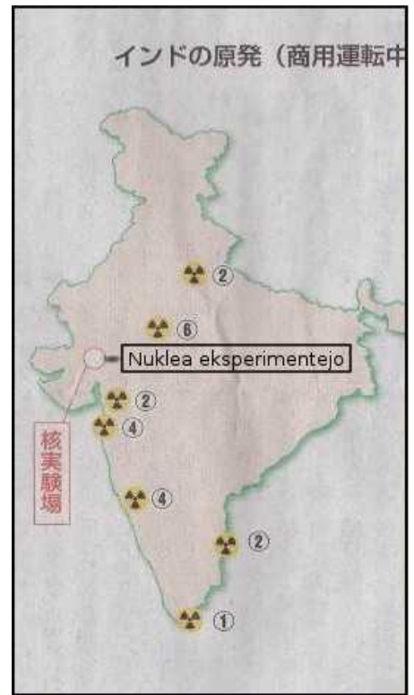
Nukleaj centraloj en Barato

La 27an de novembro Japanio eĉ rifuzis subskribi la rezolucion pri okazigo de kunsido de la asembleo de Unuiĝintaj Nacioj por aboli nukleajn armilojn. Nun Japanio fariĝis tute ne respektinda lando en la mondo.