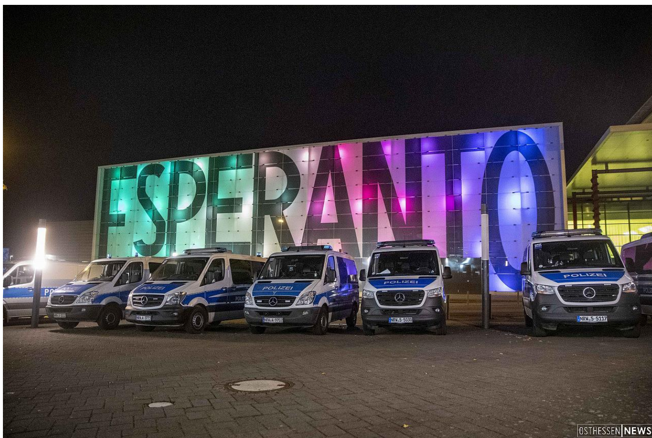
Foto: Kultura Centro "Esperanto" en Fulda, Germanio. Okaze de demonstracio en Dannenröder Forst

Warum so viele Polizei-Mannschaftswagen rund ums Esperanto standen: