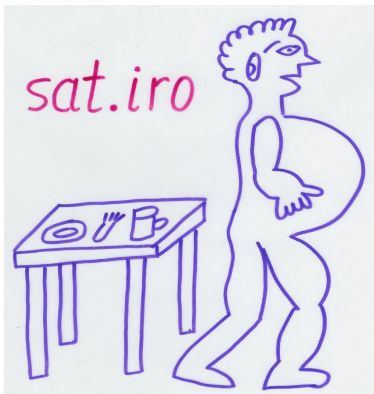
Helsinki 2019