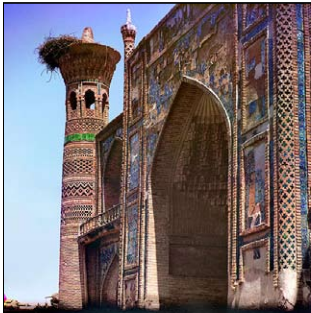
Samarkando - lulilo de la Uzbeka

La uzbeka apartenas al tjurka familio de lingvoj, same kiel kazaĥa, turkmena, tataro, jakuto kaj aliaj. Dum pasinta jarcento ĝi havis kvar skribsistemojn – araban, latinan, cirilan kaj denove – latinan. Tiom ofta ŝanĝo de alfabetoj tendencas malfavore influu la kulturfonon de popolo ĉar ĉiu-foje perdiĝas akumulitaj scioheredaĵoj. Araba skribsistemo ne tre bone taŭgis por la uzbeka pro la malfacileco skribi vokalojn. Post kiam Uzbekistano fariĝis parto de Sovetunio, oni enkondukis la latinan skribmanieron, verŝajne uzante turkan lingvon kiel ekzemplo. Krom la uzbeka, kelkaj aliaj lingvoj transiris al la latina. Sed post dek jaroj la latina estis anstataŭigita per la cirila, kiu estis uzata dum kelkdek jaroj antaŭ la disfalo de Sovetio en 1990-aj jaroj. En tiu tempo kelkaj nove sendependaj respublikoj, inkluzive de Uzbekio, celis plie apartiĝi de la iama metropolo Rusio kaj kiel metodo ekprojekti forĵeti la cirilan alfabeton. Estis starigita la demando – kiun sistemon ekuzi por la uzbeka. En tiuj jaroj komputiloj ekludis gravan rolon, sed tiutempe ili ne funkciis tre bone kun ne-latinaj skribadoj. Do la araba alfabeto ne havis ŝancon. Oni decidis ekuzi la latinan, sed malsaman tipon ol antaŭ