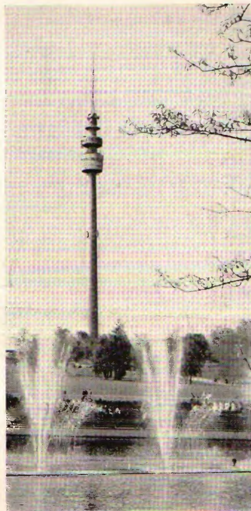
210 metrojn alta estas tiu ĉi nova urba simbolo.

Pro sia situo Dortmund povas ĉerpi kiel unua el tiu komuna fonto. La dortmunda kompanio por akvoprovizado jam deponitaj ekzistoj klopodas liveri nur bonkvalitan akvon. Tial ĝi prenas la akvon ne rekte el la rivero, sed el multnombraj putoj troviĝantaj en la Ruhr-