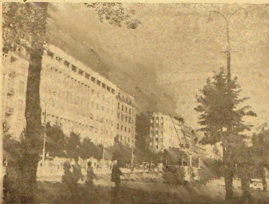
Centro de Beogrado

polo el malgranda kaj primitiva balkana urbo. Ĝin ŝatas ne nur beogradanoj sed la tuta lando ĉar ĝi estis la unua viktimo de la milita atako, kaj en ĝi la Centra komitato de la Komunista partio de Jugoslavo sub gvidado de Marŝalo Tito, faris sian historian decidon — levigi niajn popolojn al naciliberiga batajo.