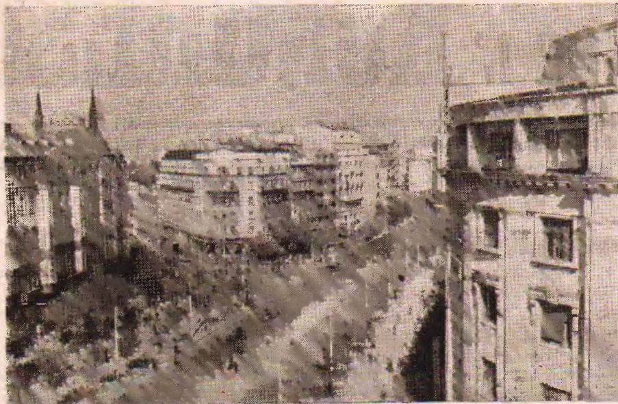
Centro de Beogrado

estas vera centro de la urbo en kiu troviĝas belaj kaj modernaj vendejoj, hoteloj, kafejoj, gravaj entreprenoj ktp. Tie troviĝas ankaŭ nia plej alta konstruaĵo, nia ĉielskrapano »Albanja« kies ekstera aspekto plibeligas la straton kaj faras ĝin pli moderna kaj pli impresa. Maldekstren komenciĝas strato de princo Mihajlo en kiu troviĝas la plej rimarkinda komerca parto de la urbo. La strato finiĝas per la Popola biblioteko, malantaŭ kiu estas la plej bela parko de Beograd nomiĝanta Kalemegdan.