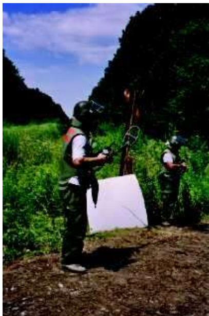
Laboro de surloka senminigo