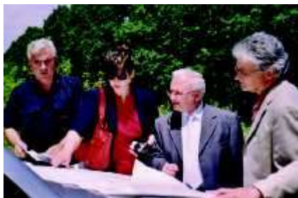
Delegacio de SAT rigardas sur mapo kia estas aktuala situacio sur la tereno minata