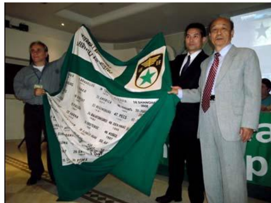
La ĉinoj transprenas la kongresan flagon