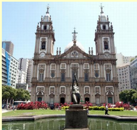
Preêjo “da Candelária”