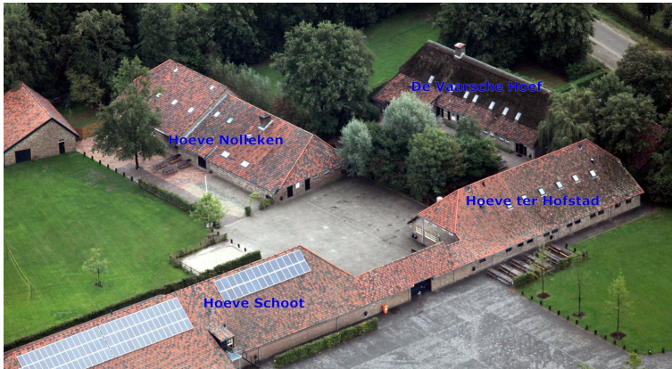
Kie dormos vi?

Bonega alirebleco. Rapidega vifio. Granda trinkejo kun frititaj manĝoj kaj noktaj koncertoj. Ĉu vi loĝos lukse, amase aŭ tende, ĉu vi manĝos vegetare, vegane aŭ viande, kaj ĉu vi alvenos fluge, trajne aŭ bicikle, la IJK en Someren bonvenigos vin.