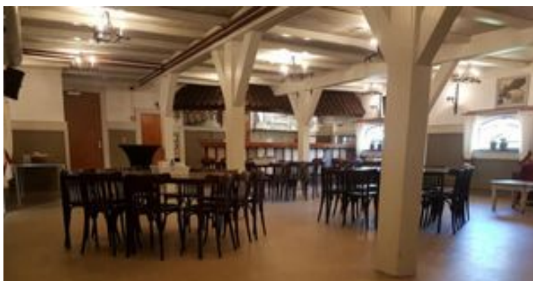
Tiu ĉi foto estas prenita antaŭ la freneza festado.

Pliajn informojn vi trovos en nia retpaĝo: