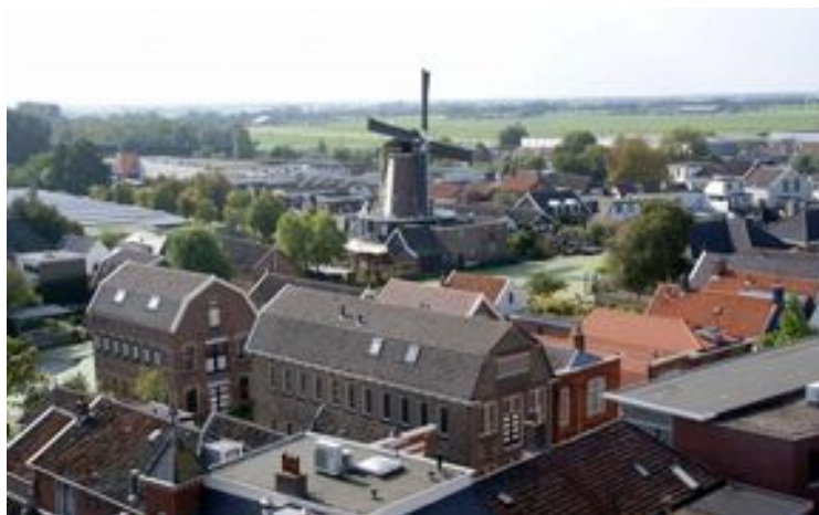
Ĉu tio ĉi estas Bodegraven?

Ĉi-jare ni trovis eĉ pli malinteresan lokon ol pasintjare por organizi eĉ pli mojosan semajnfino: Bodegraven . Laŭ diversaj konspiraj teorioj la urbeto ne ekzistas. Malgraŭ tio la loko troviĝas en bela verda kamparo inter lagoj kaj riveretoj.