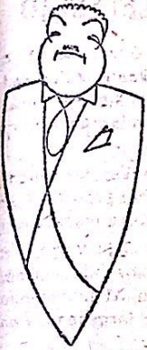
MARTINEZ BARRIO modera respublikano Prezidanto de la Parlamento

● Nordamerika ĵurnalisto tute prave asertis: «La demokratiojn nur estas forte ligitaj por krei interkonsenton pri konstantaj cedoĵoj». ● Monarkia eksministro Goicoechea en San Sebastian, la 22. Novembro, deklaris, ke post Marto 1934.