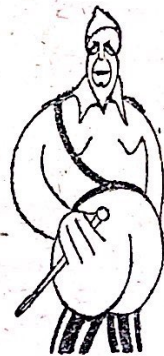
GENERALO POZAS Tre lojala amiko de la popolo k estro de la armeo en Aragono

Kontraste al la glaciaj diplomatatoj, ni estas la varma suko de pasia popolo. Ni estas... Hispanio, la unua lando, kiu, anstataŭ submetiĝi, rezistis, repuŝis k eĉ jam nun atakas ofensive la akumulitajn armilojn de l' faŝismo internacial