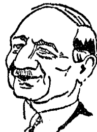
DELBOS vojaĝa ministro

Tiu vero, do, estu nia advokato. Pri tiu, ŝajne, stranga knedajo el pravo k forto, devas agitati en siaj landoj la sinceraj amikoj de la hispana civitanaro. La lastaj vizitantoj konfesis, ke antaŭ ol la ekveturo oni parolis al ili inside pri tumultema popolo, k ili trovis ĉi tie ordigitajn amasojn; oni aludis pri hordoj sovaĝaj, k ili trovis ĉi tie perfektajn brigadanojn kun disciplino, konscio k kuraĝo, ĉefaj kolonoj de taŭga armeo, kiu batalas ne por unu kasto sed kontraŭ ĉiuj kasto; ne kontraŭ unu popolo sed por ĉiuj popoloj! Dum la la soldatoj batalas heroe, rapidigante verdikton kun laŭroj de venko por justo, Hispanio prezentas ankaŭ, kiel akson de sia potenco kuraĝo, al la universala juĝantaro, la veron de sia ekzemplo, kies reflektaj estas decidaj ĉar, sur la fronto internacia, la mensogoj estis por ni pli damaĝaj ol blekado de kanonoj. Kaj la saĝa instinkto de aliaj popoloj vekigis k marŝos finfine, por frandi mielojn, sur la sama vojo, kiun signis unue per sango nia romantika verol