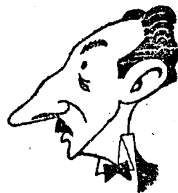
CHAUTEMPS Ĉefministro de Francio

Ja nia milito tro daŭras, por kelkaj «amikoj» de la hispana popolo. Nia rezisto plilongigas «ĝenan» konflikton. Dankon al la bonintenculoj, kiuj volas eviti al ni suferojn... sed ne ankoraŭ la popolo venkis k ĝi luktos ĝisfine kontraŭ Franko... k kontraŭ la bondeziroj de la bonkoraj disvastigantoj de «pliaĉaj» falsaj. Almenaŭ tia estas nia «malbona» intencio!