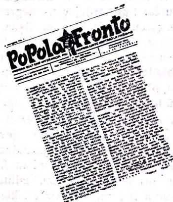
Unua numero de la nederlandlingva POPOLA FRONTO

En nia milito, en nia dramo, la internacia gazetaro estas gravega faktoro. Jam ĉe la komenco, afero tiel klara, tiel digna, kiel tiu de popolo staranta en defendo de rajto k lego, aperis en la ĉefaj paĝoj, de la reaktia k trusta gazetaro, kiel brua tumulto de «ruĝaj» bandioj. La honestaj modestaj gazetoj, de laboristaj k veraj demokratiaj partioj, ba-