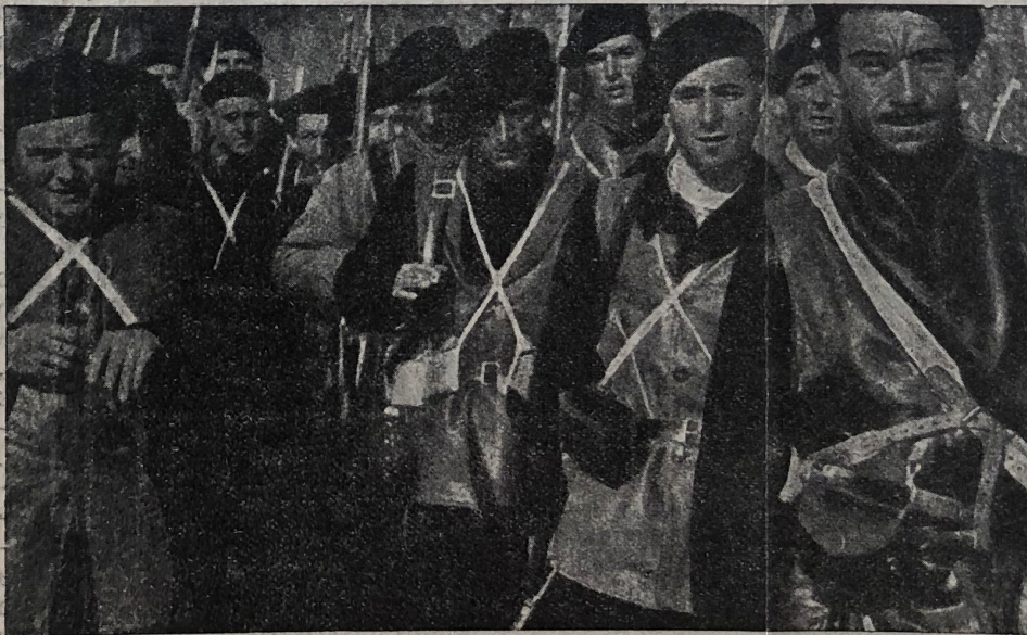
INTERNACIA KONTRAŬFAŝISTA SOLIDARO

De antaŭ multe da tempo la konscienco de eŭropa kapitalista klaso malvivas; se iu dubas pri tio, bonvolu konstati ties silenton antaŭ madridaj masakroj. Nur laborista klaso kapablas hodiaŭ varti sentojn de homarismo. Kiuj ne mortigis en siaj koroj tiujn homamajn elementajn sentojn, kiuj ankoraŭ kapablas indigniĝi antaŭ murdo al sendefendaj viroj k virinoj, devas aliĝi al la movado fervore organizita de la laborista klaso.