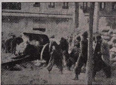
FAZO DE BATALO EN LA ANTAŬURBO DE MADRIDO

Ĉar viroj forestis, la pastroj mem prenis fusilojn k iris en la tranĉeojn.