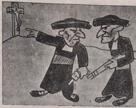
INTER «KRISTANAJ» PASTROJ —Tiu stultulo neniam sciis ion pri Politiko

En Sidi-bel-Abbés — malgranda urbo de la Orana departemento —, la hispanaj faŝistoj, kun fia helpo de siaj francaj kolegoj, donis teruran batadon al la konsula reprezentanto de Hispanio. Tio okazis antaŭ kelkaj semajnoj, dum la pedeloj de Johano