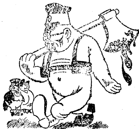
La grandeco de faŝisto estas ĉiam laŭe proporcia al la eteco de demokrato

● La itala anonima societo «Ernesto Breda» fabrikanta preskaŭ ĉiujn aereo-