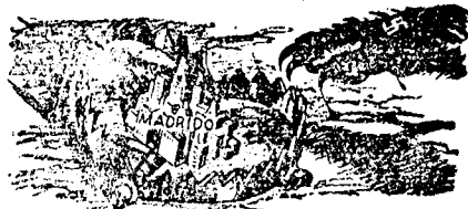
Madrido tente logas, sed...

Diru tion, nianome; en la nomo de ĉi tiuj etuloj, al tiuj, kiuj sin kredas tre grandaj. Diru ankaŭ, ke ni vidas la anglan popolon, kiel fratan popolon. Ke ni ne miksas la liberalan Anglion kun ĝia konservativa registaro. Pro tio ni ankoraŭ esperas, el la regatoj, la justecon, kiun jam longedaŭre rifuzadas al ni la britaj elegantaj regantoj.»