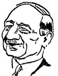
DELBOS vojaĝa ministro

Tiu vero, do, estu nia advokato. Pri tiu, ŝajne, stranga knedaĵo el pravo k forto, devas agitati en siaj landoj la sinceraj amikoj de la hispana civitanaro. La lastaj vizitantoj konfesis, ke antaŭ ol la ekveturo oni parolis al ili inside pri tumultema popolo, k ili trovis ĉi tie ordigitajn amasojn; oni aludis pri hordoj sovaĝaj, k ili trovis ĉi tie perfektajn brigadanojn kun disciplino, konscio k kuraĝo, ĉefaj kolonoj de taŭga armeo, kiu batalas ne por unu kasto sed kontraŭ ĉiuj kasto; ne kontraŭ unu popolo sed por ĉiuj popoloj! Dum la la soldatoj batalas heroe, rapidigante verdikton kun laŭroj de venko por justo, Hispanio prezentas ankaŭ, kiel akson de sia potenca kuraĝo, al la universala juĝantaro, la veron de sia ekzemplo, kies reflektaj estas decidaj ĉar, sur la fronto internacia, la mensogoj estis por ni pli damaĝaj ol blekado de kanonoj. Kaj la saĝa instinkto de aliaj popoloj vekigis k marŝos finfine, por frandi muelojn, sur la sama vojo, kiun signis unue per sango nia romantika verol