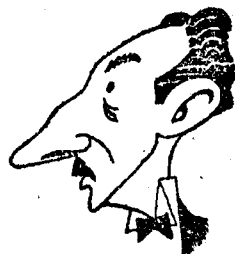
CHAUTEMPS Cefministro de Francio

Ja nia milito tro daŭras, por kelkaj «amikoj» de la hispana popolo. Nia rezisto plilongigas «ĝenan» konflikton. Dankon al la bonintenculoj, kiuj volas eviti al ni suferojn... sed ne ankoraŭ la popolo venkis k ĝi luktos ĝisfine kontraŭ Franko... k kontraŭ la bondeziroj de la bonkuraj disvastigantoj de «plaĉaj» falsajfoj. Almenaŭ tia estas nia «malbona» Intencol