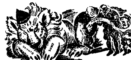
La leono vekigas pro juko en la vosto...

Ni kompreneble ne deziras nun detale ekzameni, kial la homoj rigardas la okazintaĵojn el kontraŭaj vidpunktoj, sed ni konstatas la fakton. La hodiaŭa individuo ne estas, nek povas esti neŭtrala. Tio ĉi estas