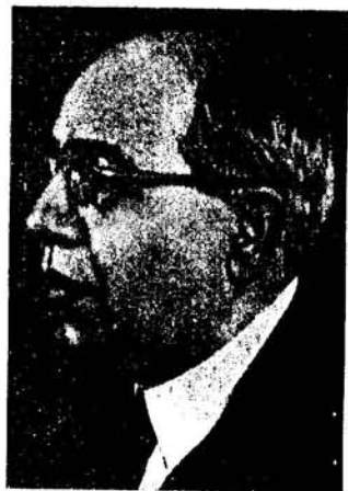
La Ekscelenca Moŝto la Prezidanto de la Respubliko Emanuelo Azaha kaj Diaz

Hodiaŭ, en ĉi tiu tago, al tiuj soldatoj flugas nia admiro k nia danko, kun la aserto ke ilia ofero tre estos utila por svingi niajn rajtojn, laŭ sola nun ebla maniero. Ni ne kulpas, se por gajni prestiĝon estas necese gajni batalojn. Oni trudis al ni la kruelan dilemon akiri la rajton per la forto. Ĉu forto do?... nu bone, jen la tutan de Hispanio! Post nia venko, sur tiu kampo de la forto, certe brilos la pura rajto de la Hispana Respubliko; ĝi brilos, tiel intense k hele, kiel brilas nun, en ĉielo, la suno de Madrido!