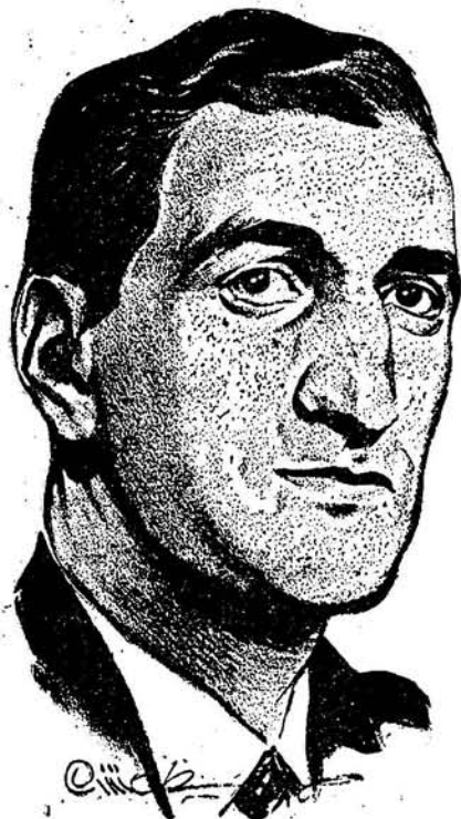
La digna katolika Prezidanto de Baskio Antonio Aguirre

regas ĉirkaŭ la senfruktaj riĉaĵoj. La plumbe nun densa silentego. Mankas brakoj por pagi la fakturojn de Hitler k de Mussolini. Mankas brakoj por produkti militmaterialon por Franko k liaj aliancanoj. Urgas solvi la problemon! Ili supozis, ke la konkero de Bilbao donus al ili senliman riĉecon k eblojn senlimajn. Sed ne restas laboristoj en Bilbao. Se restas kelkaj, ili sin kaŝas, ne atentis la alvokon k serĉas la manieron, profiti la noktan mallumon por kuri for, al siaj klasfratoj.