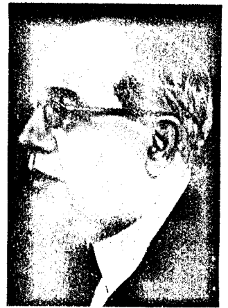
Lia Ekscelenca Moŝto la Prezidanto de la Respubliko Emanuelo Azana kaj Diaz

Hodiaŭ, en ĉi tiu tago, al tiuj soldatoj flugas nia admiro k nia danko, kun la aserto ke ilia ofero tre estos utila por svingi niajn rajtojn, laŭ sola nun ebla maniero. Ni ne kulpas, se por gajni prestiĝon estas necese gajni batalojn. Oni trudis al ni la kruelan dilemon akiri la rajton per la forto. Ĉu forto do?... nu bone, jen la tutan de Hispanio! Post nia venko, sur tiu kampo de la forto, certe brilos la pura rajto de la Hispana Respubliko; ĝi brilos, tiel intense k hele, kiel brilas nun, en ĉielo, la suno de Madrido!