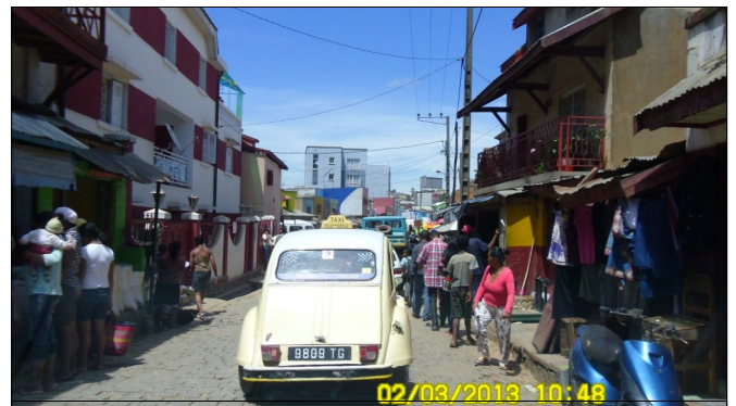
Kiam oni decidos renovigi ankaŭ la malnovajn taksiojn de la ĉefurbo?

Tri mil busetoj trairas la ĉefurbon ĉiutage. Ĉu efektive pliboniĝos la proponata servo se la decido restas nedevisa por ĉiuj? Ĉu malaperos la infere ĉiutaga trafikŝtopiĝo kaj kien enmeti tiujn malnovegajn busetojn, kies rajto transporti estos forprenita?