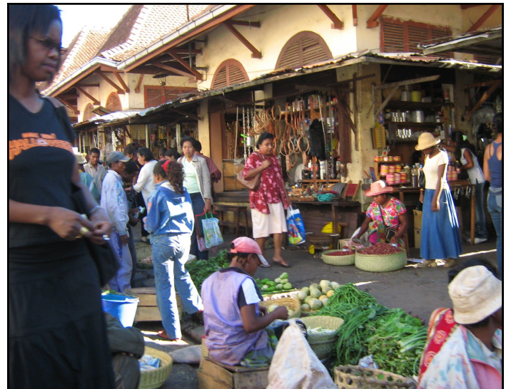
Tia ŝajna vivnormalaĵo kaŝas daŭran timon pri la estonteco. La simpla civitano havas la impreson ke li ne plu regas sian vivon

Aŭdiĝas atakoj tie kaj ie en la granda urbo kaj altiĝas la nombro de viktimoj pri poŝtoŝtelistoj. Dum en la kamparo, la « dahalo » (organizita bando de bovŝtelistoj) detruas la kamparan komunumon raziante tutan teritorion. Ĝendarmoj kaj armeoj estas nun devigataj uzi helikopterojn por batali kontraŭ tiajn ŝtelistojn. Pro la sinsekvaj politikaj kri-