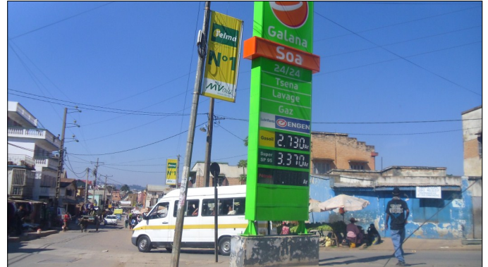
Alveno de tiuj belaj germanaj busoj ne solvis la problemon de trafikŝtopiĝo

ĉiutagan enspezon. Tiuj busetoj estos afrankitaj de doganimpostoj. Plie, unuopa buseto kostas proks. Ar 80 milionojn. Dum kvin jaroj, la membro de la sindikato pagos iom post iom parton de tiu kosto sed li/ŝi ne rajtas enkasigi la ĉiutagan enspezon ĝis finpago de la tuta monsumo. Li/ŝi libere disponigas pri sia aŭto nur