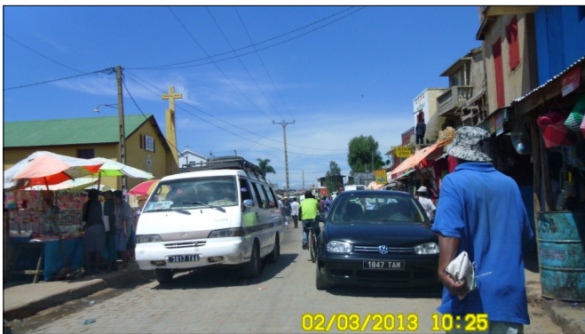
Tro da busetoj montras la amatorecon de transportistoj de niaj grandaj urboj

Jam delonge la sindikato petis de la registaro starigon de iu centro, kie la membroj rajtas aĉeti avantaĝkoste aŭtopecaron. Sed neniu respondis al ilia peto. Kaj nun, post multaj interkonsiliĝoj, sindikato kaj registaro interkonsentis pri la nova maniero enporti novajn busetojn cele al renovigo de la busoj en la ĉefurbo. Kaj akriĝas la veturad-problemoj tiel, ke la registaro decidis kunlabori kun la profesiuloj de pasaĝer-transportado.