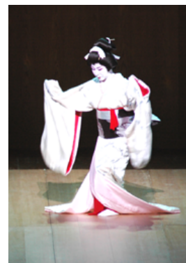
japana danco “egreto”

“Korta danco por mi, japano, ne estis interesa, ĝi estis eĉ enuiga (mi fakte iomete dormetis). Tamen spekti tiu-tipan spektaklon estas por plimulto la unufoja sperto, do certe spektenda. Plej ŝatinda al mi estis ‘ bujoo-danco ’: ŝiaj movoj estis belaj, ĉarmaj kaj lertaj (ŝi estis fotinda en ĉiu momento). La parto kun tamburoj estis por miaj oreloj kutima, sed malgraŭ tio