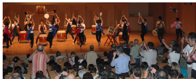
en la fino, tamburado de junuloj