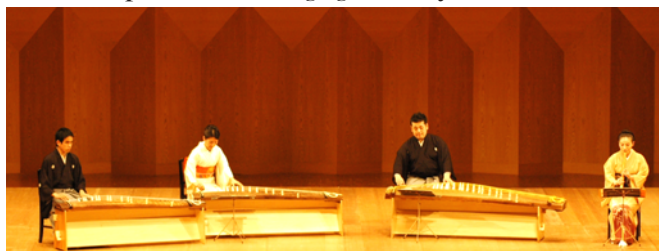
ludado de kotoo