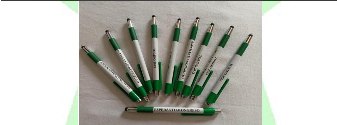
Biro UK Torino € 1,00 al pezzo

Mendu ĉe la libroservo de IEF: feilibri@esperanto.it