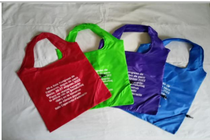
Borsa per la spesa in cotone con scritte bianche. Per i gruppi € 5,50 (catalogo € 8,00).