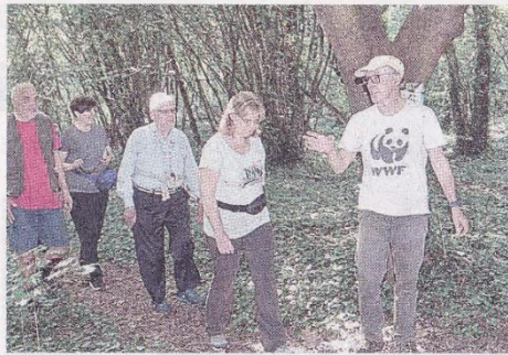
Tra le associazioni anche quella del WWF con i volontari di Pistoia

Da più di sei mesi la posta non arriva più, gli incontri si svolgono (se si svolgono) in garage di fortuna. Impossibile accedere al proprio materiale d'archivio, dove per alcuni sono custoditi dati sensibili imprescindibili all'esercizio dell'attività, ma soprattutto quel che da più di sei mesi manca come l'aria è il principio su cui si basa l'associazionismo: la condivisione, l'incontro, tutti elementi che concorrono ad alimentare la solidarietà sociale. Qui via dei Cancellieri numero 30. La chiave nella topa della 'storica' casa delle associazioni per i vecchi inquilini da mesi non gira più. Serratura cambiata, edificio inaccessibile. E così una platea di circa duemila persone tra soci e fruitori per una dozzina e più di associazioni da un giorno all'altro si è trovata appiadata. Per capire come si è arrivati fin qui occorre fare un passo indietro. Da decenni in quell'edificio di proprietà comunale trovano casa diverse