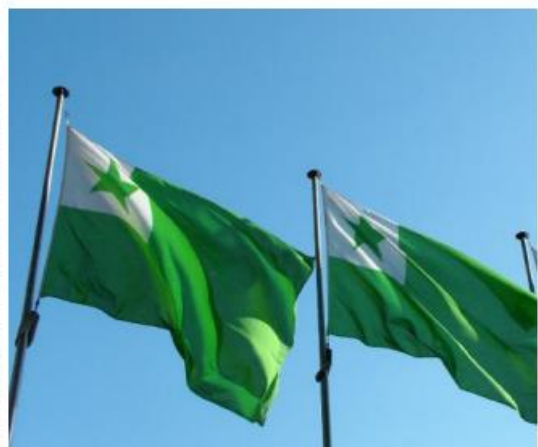
La lingua Anche a Vicenza si parla l'Esperanto, grazie al lavoro di diffusione di un gruppo di appassionati