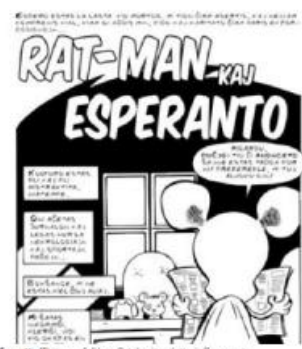
Il fumetto Rat-man di Leo Ortolani tradotto in Esperanto