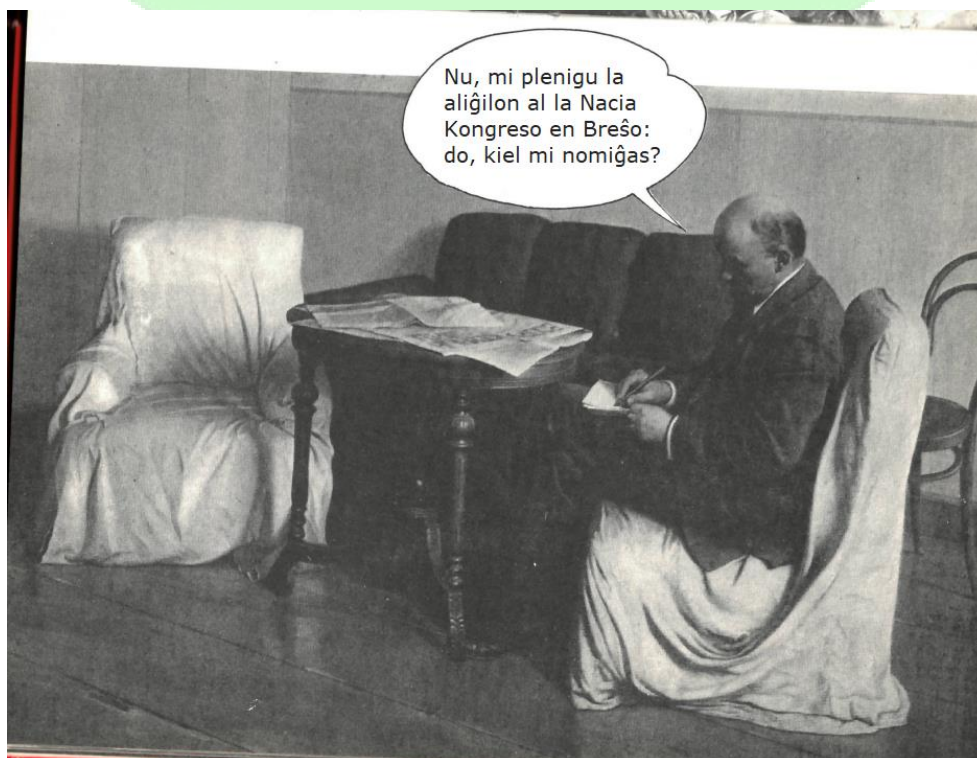
Brodski Isaac Israilevitch, Lenin en Smolny