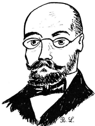
D-ro L.L. Zamenhof (I859-I917)