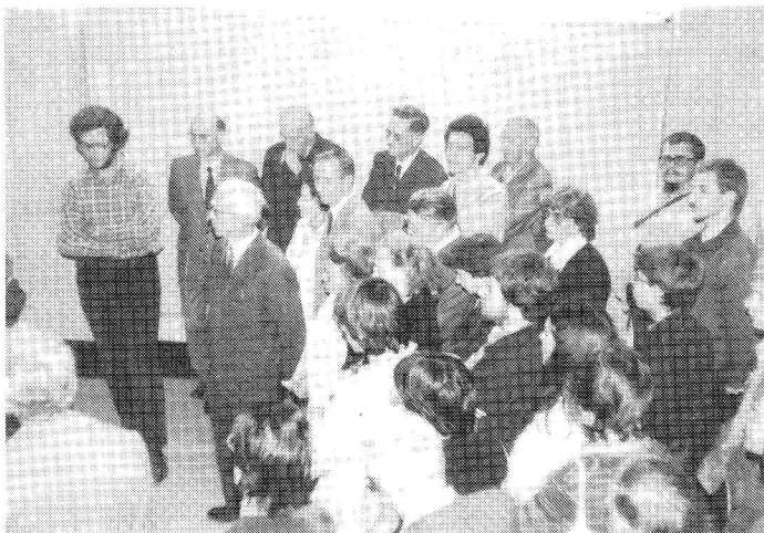
★Foto 1 : ekspozicio pri Esperanto en la centra urba biblioteko de Lille.