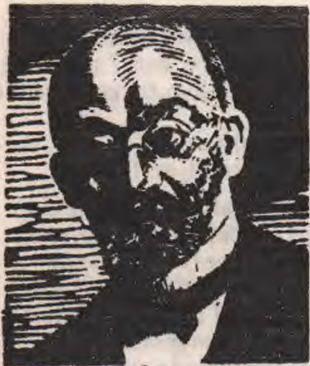
Aŭtoro de Esperanto D-ro L. L. Zamenhof (1859 - 1917)