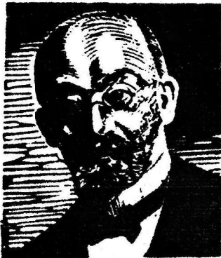
Aŭtoro de Esperanto D-ro L. L. Zamenhof (1859 – 1917)