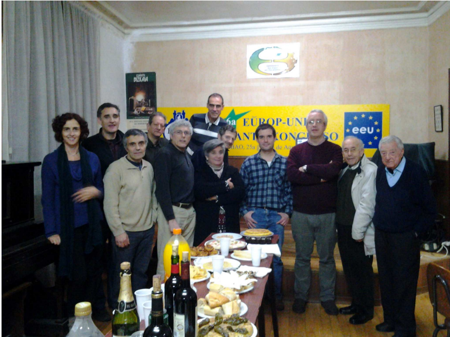
La ĉeestantoj pozas antaŭ la komuna vespermanĝo.