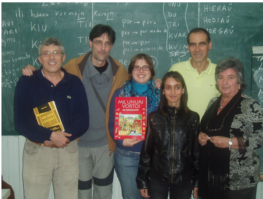
gelernantoj de la nova kurso de Esperanto pozas, en la klasejo, kun la instruisto.