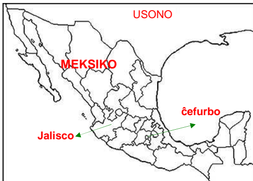
Bildo 1. Meksiko - Jalisco

En la okcidenta parto de Meksiko troviĝas la ŝtato Jalisco (Ĥalisco) (bildo 1), kies ĉefurbo estas Guadalajara (Guadalaĥara) (Bildo 2).