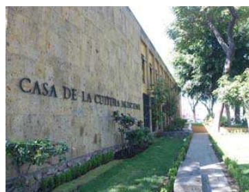
Foto 3. Casa de Cultura Jalisciense

Kadre de la 11a Meksika Esperanto Kongreso, Meksika Esperanto Federacio , la germana fondaĵo “ Stiftung Mondo ” kaj la Ministerio pri Kulturo de la Ŝtato de Jalisco (Ĥalisko) unuigas fortojn por oferti al la ĝenerala publiko specialan kaj nekompareblan koncerton en kiu la etoso iros ekde la melodiaj notoj de la piano kaj de la fagotoj ĝis la sonoj de Rock en la Esperanta, hispana, franca, japana, angla, rusa, okcitana, pola, inter aliaj lingvoj, unuigante la miksaĵon de pluraj lingvoj kaj distingante la apartecon de la universalaj lingvoj: “ MUZIKO KAJ ESPERANTO ”