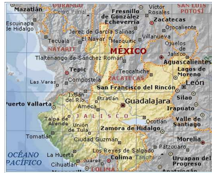
Bildo 2. Jalisco - Guadalajara

Kulture, oni konsideras al “Guadalajara” kiel la plej emblema urbo de la lando, kiu monde donis la ikonografian bildon de Meksiko, ĉefe pro “ Los Mariachis ”, “ El Tequila ” kaj “ El Charro ”, tiu lasta estas la reprezenta figuro de la meksika popolo.