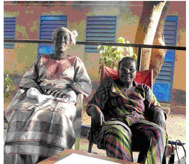
Sababougnouma en Bobodiulaso

➤ Miriyagnouma en Yegueré : la tuta grupo devas pripensi pri la monsumo de la mikrokredito por financi ilian projekton de komercigo de grenoj, kaj transdoni sian proponon al la Administra Konsilantaro de MSM.