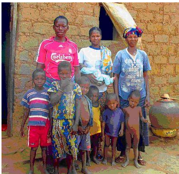
Kiemere en Dingaso

➤ Kiéméré en Dingaso : le gea grupo pripensos sian projekton (bredado) surbaze de mikrokredito.