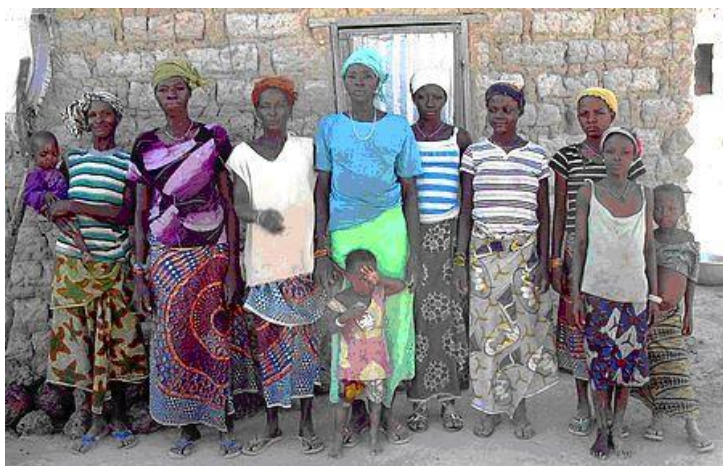
Sinignansigui en Dodougou

13an de decembro 2012, 18an de januaro kaj 4an de marto 2013