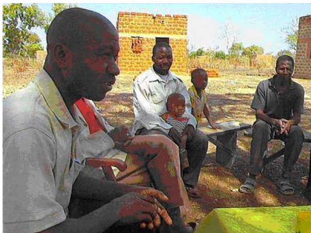
Bandendeme en Panamaso

➤ Bandendeme en Panamaso : la gea grupo travivis malfacilaĵojn. Iu el la membroj malsaniĝis kaj enhospitaliĝis ; la aliaj mone helpis lin.