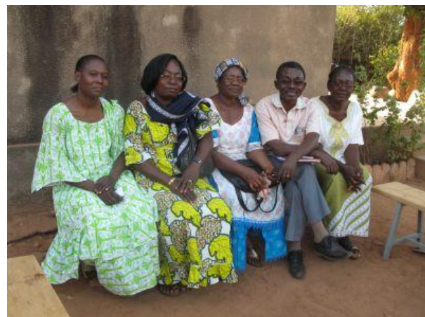
Asocio « Marie-Reine »

➤ Asocio « Marie-Reine » : pro la decido de la Administra Konsilantaro tiu gea grupo malsupren revizios la projektan monsumon (porkobredado).