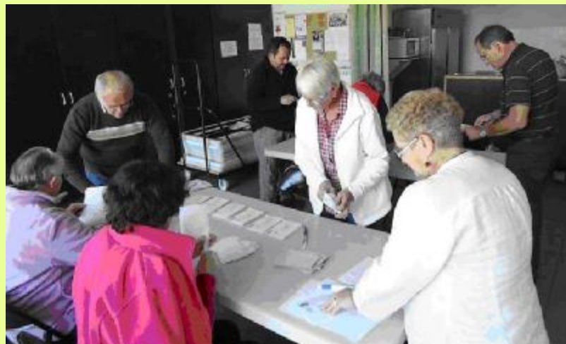
Malfermo de la respondkovertoj

Dum en 2004 nur la grupoj reprezentitaj en la Ĝenerala Asembleo povis voĉdoni, ĉi foje la Federacia Administra Konsilantaro decidis organizi la balotelektojn per “universala” voĉdonado laŭ la demokrata kaj mutualisma principo : unu homo = unu kotizo = unu voĉo.