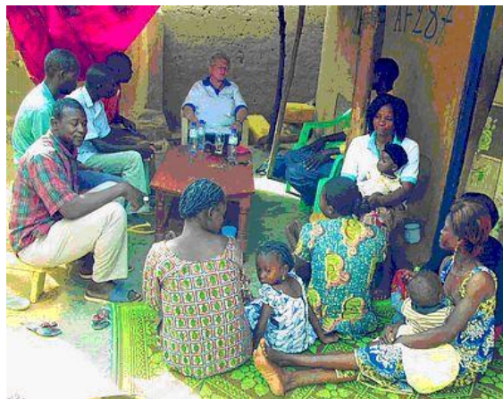
Wend Panga en Wati-Nooma

➤ Wend Panga en WatiNooma : tiu grupo firme volas elvolvi sian projekton de konservado de fruktoj kaj legomoj per sekigo. La membroj serĉas ĉiujn informojn pri la sekigaj teknikoj kaj pri la uzado de sunforno.