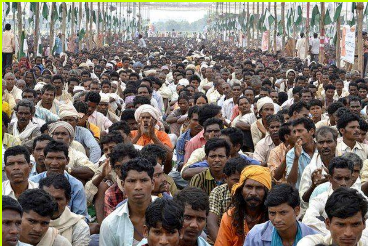
Hindaj kamparanoj, Gwalior, Madhya-Pradeŝo, komence de Jan Satyagraha 2012

En la bulteno n° 107, ni prezentis al vi la grandan marŝon nomitan "Jan Satyagraha", Hindia esprimo, kiu signifas "aktiva traserĉado de la vero, de la justeco".