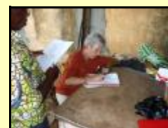
kaj la federacia sekretario