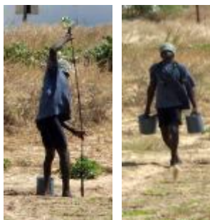
Ĉerpado de akvo

Inter siaj projektoj, ili pripensas pogutan irigacisistemon funkciotan per renovigebla energio (suna kaj aŭ venta).